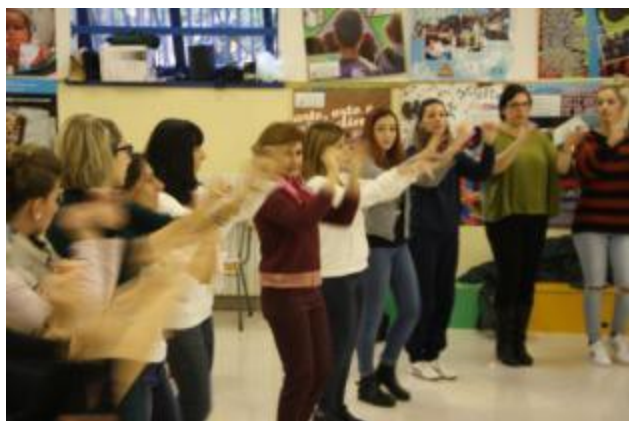
Foto 1 e 2 - riscaldamento iniziale e giochi di accoglienza