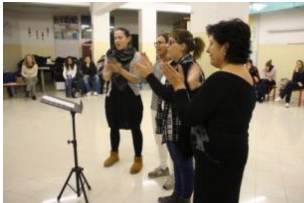
Foto 17 e 18 - Attività del sottogruppo 5 ( Menù ritmico e body percussion )