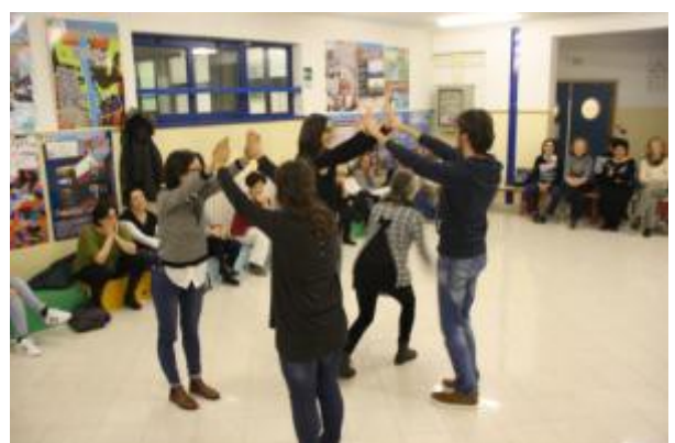
Foto 15 e 16 - Attività del sottogruppo 4 ( Clock l'orologio e body percussion )