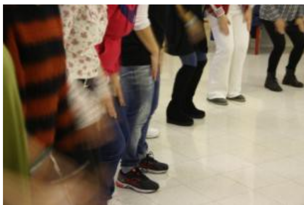
Foto 5 e 6 - Body percussion (mani e cosce)