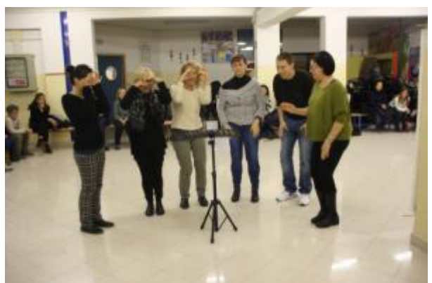
Foto 13 e 14 - Attività del sottogruppo 3 ( Animal band e body percussion )