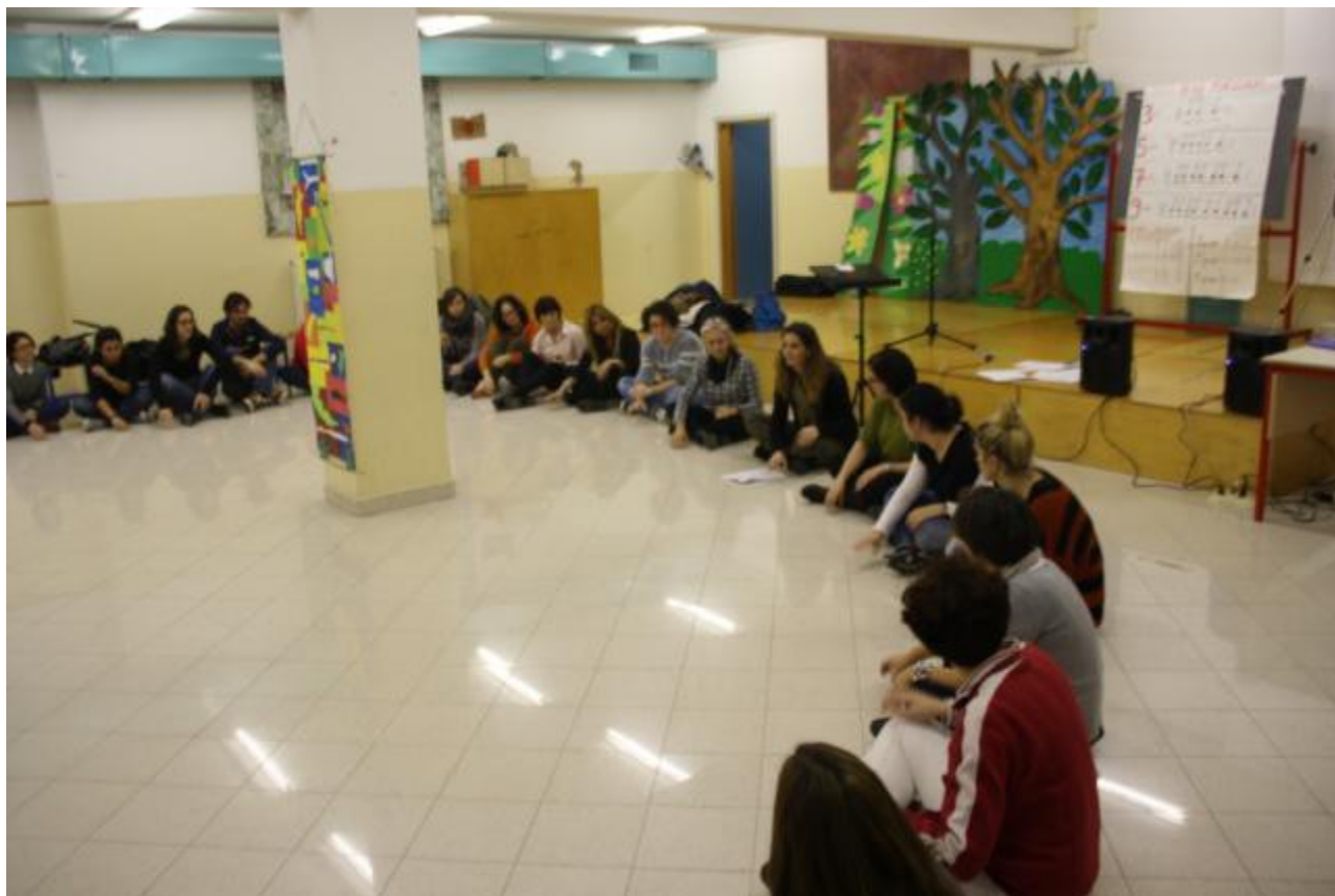
Foto 19 - Conclusione dell'attività ( Take five e body percussion )