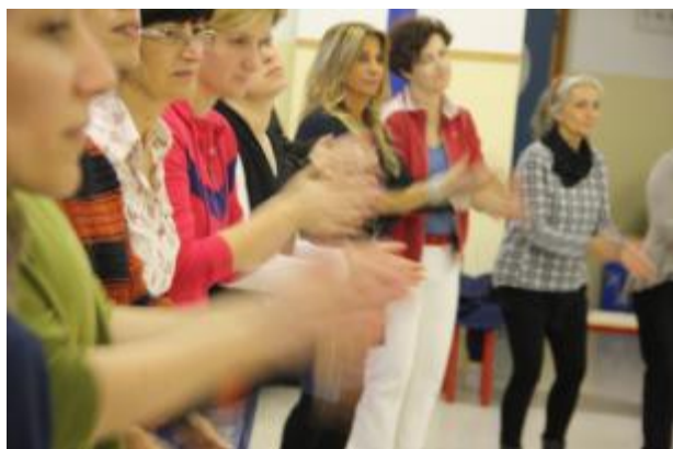
Foto 3 e 4 - Body percussion (petto e mani)