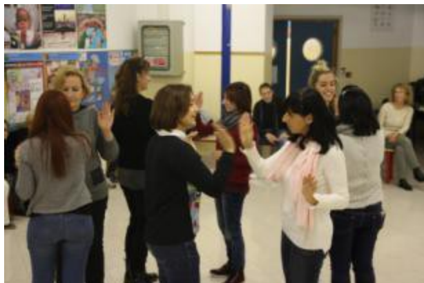
Foto 9 e 10 - Attività del sottogruppo 1 ( Ribbon dance e body percussion )