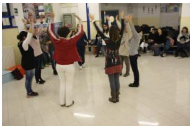
Foto 11 e 12 - Attività del sottogruppo 2 ( Taco j punta e body percussion )